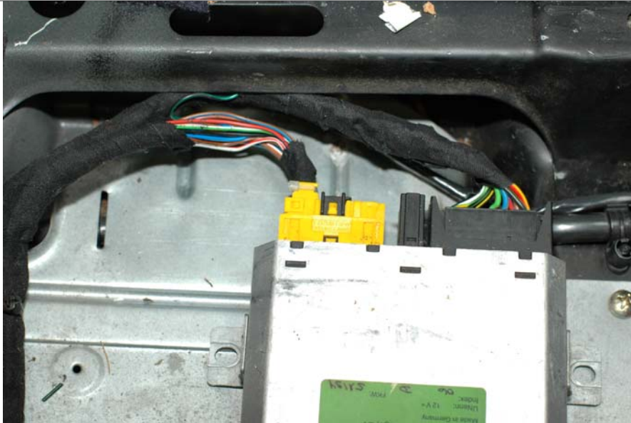
Alarm/ZV Modul unter Beifahrersitz